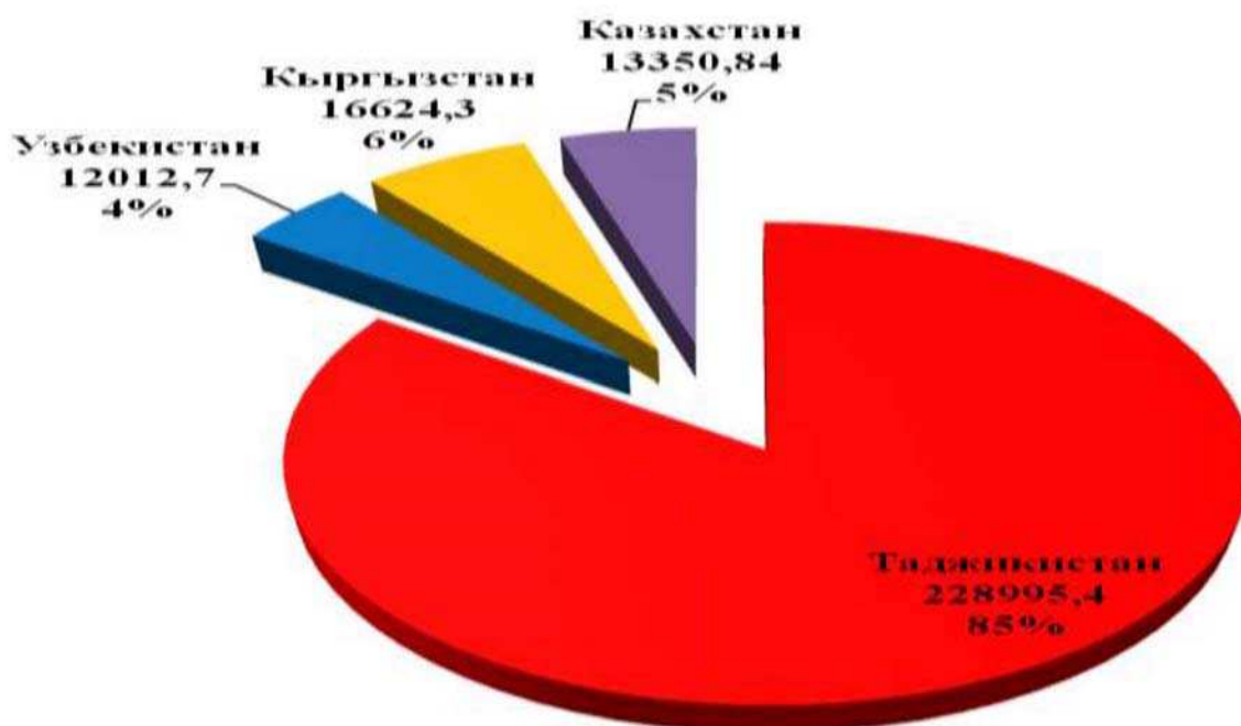
Рис. 2 Количество изъятого НС героин у граждан и выходцев стран ЦАР, задержанных территориальными органами ФСКН России за наркопреступления в 1 полугодии 2012 г., грамм; %.

Наиболее активное участие в наркобизнесе на территории РФ принимают граждане Таджикистана, проживающие на территории Хатлонской области (задержано 54 лица), из которых наибольшее количество является жителями Яванского района (12), г. Нурек (7) и г. Курган-Тюбе (6). Следующие места в этом «списке» занимают жители столицы республики - города Душанбе (37), Согдийской области (28), районов республиканского подчинения (22) и Горно-Бадахшанской автономной области (9, в том числе 5 из г. Хорог).